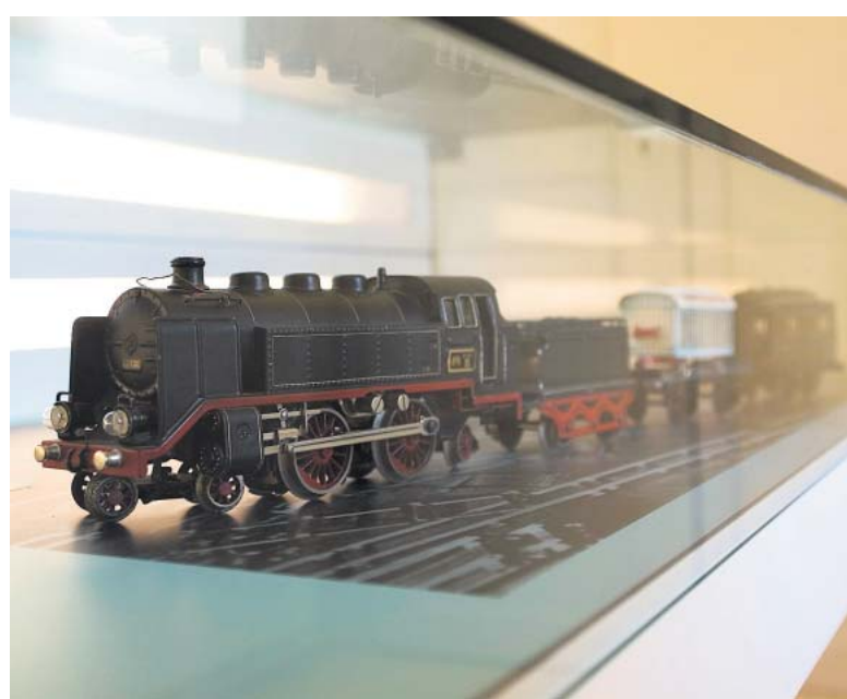
Dirigent, Zeichner, Bahnfreund: Die längste Zeit seines Lebens hat Paul Hindemith in Frankfurt verbracht – auch wenn er nur fünf Jahre ständig im Kuhhirtenturm wohnte. Nach dem Krieg kehrte er zeitweise als Gast zurück; 1962 leitete er ein Museumskonzert (Foto links). Der Flügel, der heute im Konzertsaal des Turms steht, ist kein Originalinstrument.